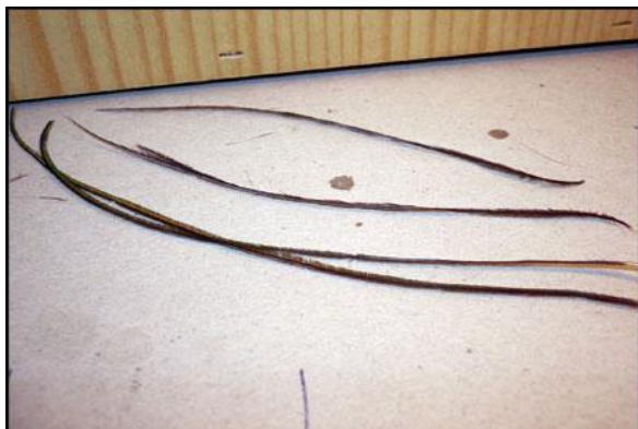
Etape 5 : prélever 2 herls de paon + 2 herls d'autruche noirs.