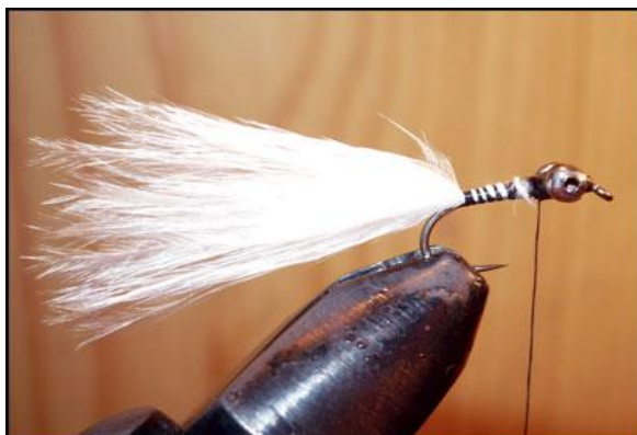
Etape 4 : fixer une touffe de fibres de marabout blanc (2-3 fois la longueur de la hampe) à la courbure, recouvrir le marabout jusqu'aux yeux puis couper l'excédent.