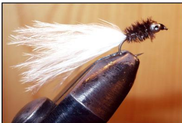
Etape 8 : faire une tête en sdm, nœud final et vernir la tête.