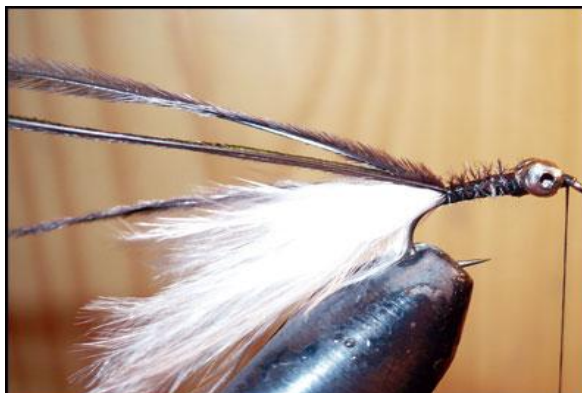
Etape 6 : fixer les 4 herls.