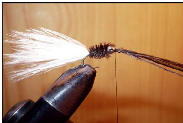
Etape 7 : tourner les herls jusqu'aux yeux, les faire passer devant les yeux et les fixer, couper l'excédent.