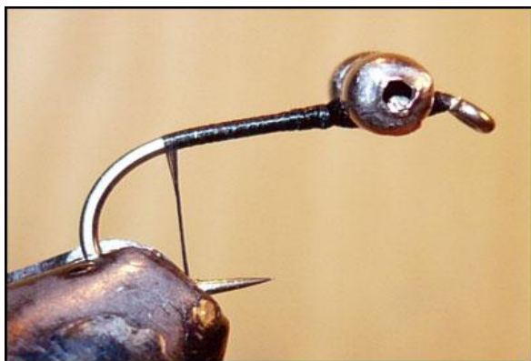
Etape 3 : amener le fil de montage à la courbure.