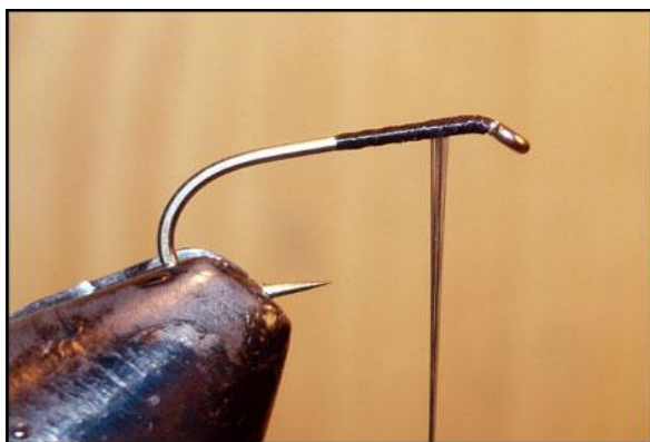
Etape 1 : enrouler la sdm sur la moitié de la hampe puis revenir au milieu de ces enroulements.