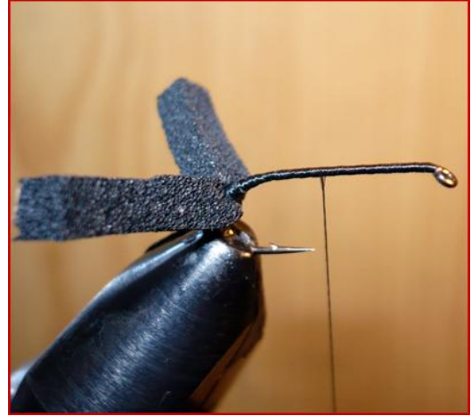
Etape 2 : Avec la soie de montage emprisonner la mousse un peu plus bas que la courbure.