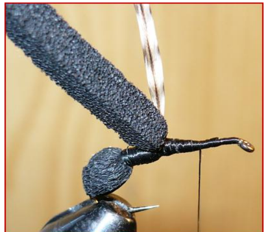
Etape 6 : Fixer une plume de cou de coq grizzly contre la mousse.