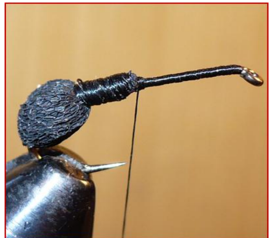
Etape 4 : Ramener les deux morceaux de mousse de chaque côté de la hampe, les fixer et bien recouvrir la mousse jusqu'à la moitié de la hampe avec la soie de montage.