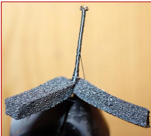
Etape 3 : étape 2 vue de dessus.