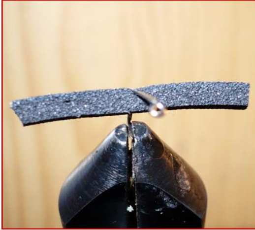
Etape 1 : Enfiler sur la hampe un morceau de mousse noire ou rouge de 2mm par 2mm.

Soie de montage noire ou rouge Plumes de cul de canard blanc