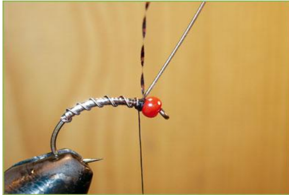
Etape 5 : cercler le corps obtenu avec le rachis.

Perle de verre (pour collier) Cristal flash argent ou autre