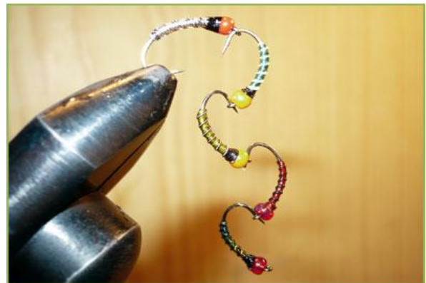
Etape 8 : quelques variantes.