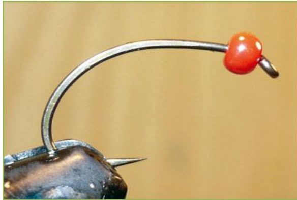
Etape 1 : enfiler la perle sur l'hameçon, rouge, rouge sang, blanc, vert, orange... les possibilités sont multiples.

Perle de verre (pour collier) Cristal flash argent ou autre