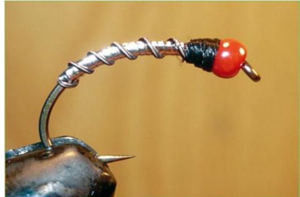
Etape 6 : couper l'excédent de rachis et de cristal flash, faire une surépaisseur avec la soie de montage à l'arrière de la perle puis le nœud final au même endroit.