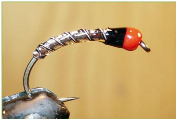
Etape 7 : passer deux à quatre couches de vernis sur l'ensemble de la mouche.