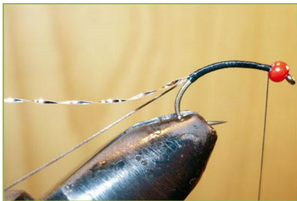
Etape 3 : fixer (en partant de la courbure et en le couvrant de sdm jusqu'à la perle) un brin de cristal flash argent ou autre.