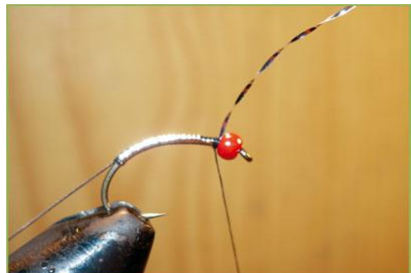
Etape 4 : enrouler le brin de cristal flash autour de la hampe.