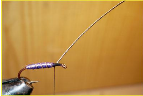
Etape 9 : cercler le corps avec le rachis. Vue de dessus.