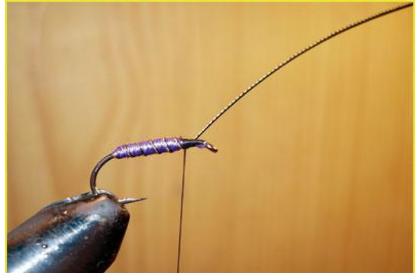
Etape 10 : cerclage vu de côté.