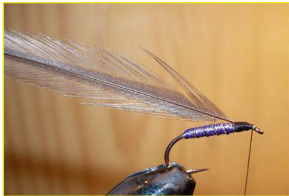
Etape 11 : éliminer l'excédent et fixer une plume de la même couleur que celle utilisée pour le corps ou... de la couleur qui vous plaît ! Les fibres de cette plume doivent faire au minimum 1,5 fois l'écartement pointe-hampe, deux fois cette longueur étant la base.