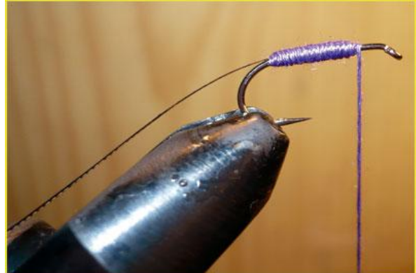
Etape 6 : avec le fil à coudre effectuer un aller retour puis revenir vers l'œillet pour donner de l'épaisseur au corps.