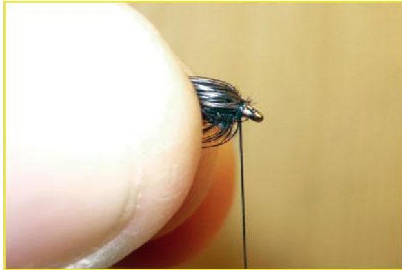
Etape 13 : prendre toutes les fibres entre les doigts et les rabattre vers l'arrière.