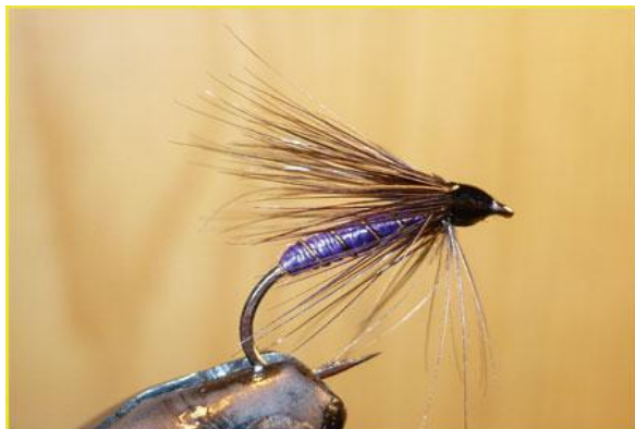
Etape 15 : faire le nœud final et vernir la tête.