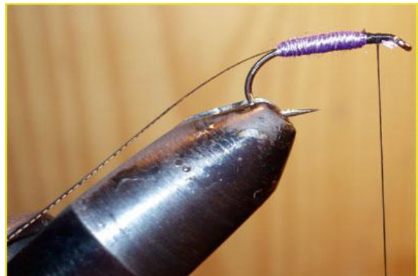
Etape 8 : recouvrir le fil à coudre avec la sdm puis quand il est solidement fixé, couper celui-ci.