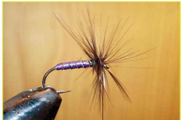
Etape 12 : tourner la plume 5-6 tours et bloquer celle-ci contre l'œillet.