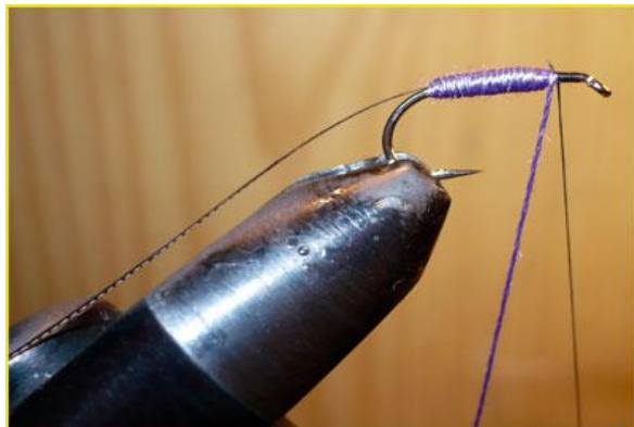
Etape 7 : fixer en tête la soie de montage noire.