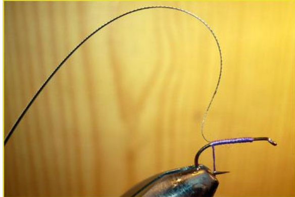
Etape 5 : fixer le rachis obtenu à la courbure, côté pointe (= côté fin).