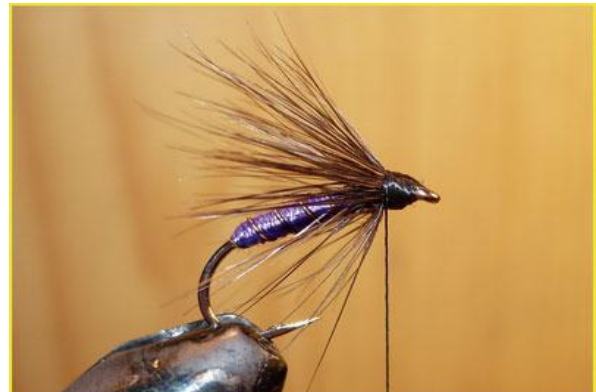
Etape 14 : avec la soie de montage, bien passer sur les fibres pour que celles-ci restent maintenues vers l'arrière, cela forme une grosse tête.